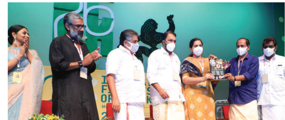
Arya Rajendran, Mayor of Thiruvananthapuram Corporation receiving the first copy of the Festival Bulletin from G.R Anil, Minister for Food and Civil Supplies